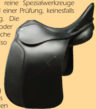
Abb 01 - Typischer, "ganz normaler" Dressursattel, mit der von vielen kritisierten kleinen Auflagefläche und balliger Kissenfüllung.

Wenige Pferde und Reiter haben am Anfang ihrer Ausbildung das nötige Feingefühl, dies zielorientiert einzusetzen. Genau in der richtigen Sekunde, den nächsten Bewegungsablauf vorausahnend, seine Gewichtshilfen einzusetzen, um dem Pferd die richtige Unterstützung zu geben. Und nun, Hand aufs Herz, wer von uns normal sterblichen Reitern besitzt diese Fähigkeit und hat dann noch ein Pferd, das motiviert mitmacht ? Wer von uns kann alleine durch seinen Sitz dafür Sorge tragen, dass vorne "mehr kommt" oder das rechte Hinterbein mehr untertritt ? Wenige können dies unter Anleitung, kaum einer, wenn er längere Zeit auf sich allein gestellt reitet. Viel wahrscheinlicher ist, dass Sie ständig zu viel Druck erzeugen, Ihrem Pferd Fehlinformationen durch den Sattel vermitteln, und anstatt es zu fördern, ihm die Lust an der Mitarbeit nehmen.